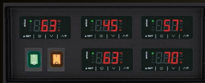
Commande avant ou arrière

La régulation par niveau permet de modifier la température ou de la couper suivant le flux de la journée