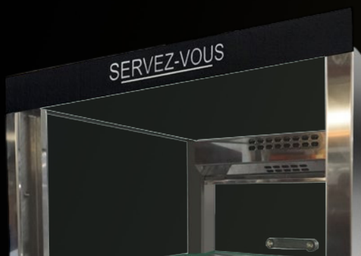
Verre sérigraphié «SERVEZ-VOUS» en option