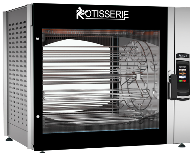
SCT8.760 + SC.PIED