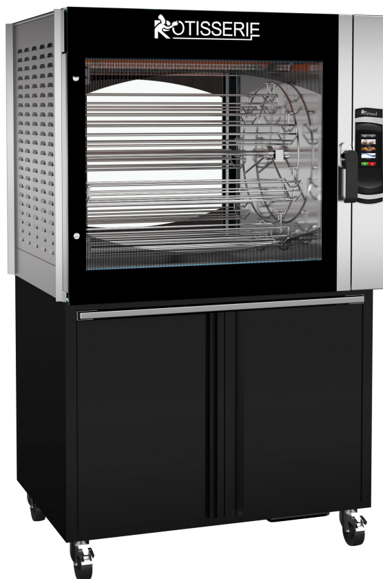
SCT8.760 + SC8.760MSTO (armoires de base en option)

Multiples recettes pré-réglées et manuelles (+ peut ajouter jusqu'à 99 programmes)