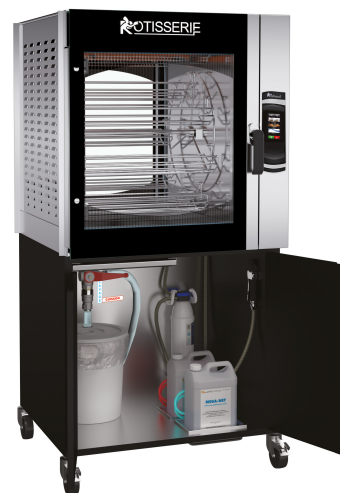
MCT8.760 + MC8.760MSTO (armoire ouverte)