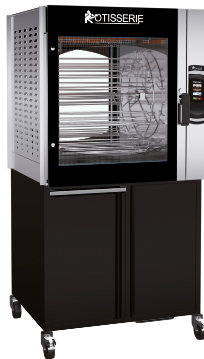
MCT8.760 + MC8.760MSTO