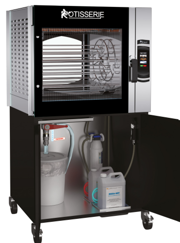
MCT5.560 + MC5.560MSTO (armoire ouverte)