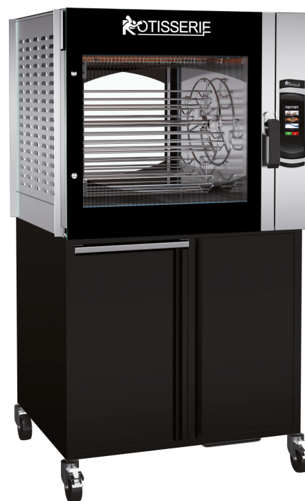
MCT5.560 + MC5.560MSTO