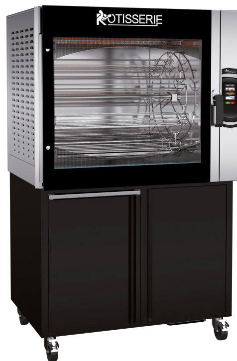
MC8.760 + MC8.760MSTO