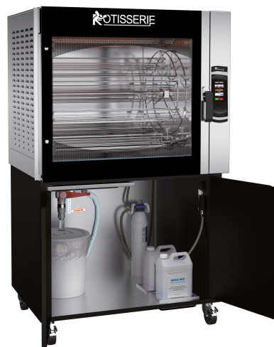
MC8.760 + MC8.760MSTO (armoire ouverte)