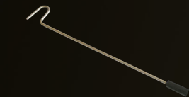
Décrocheur de broches