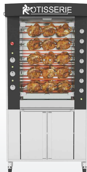
975.5MSE Finition inox