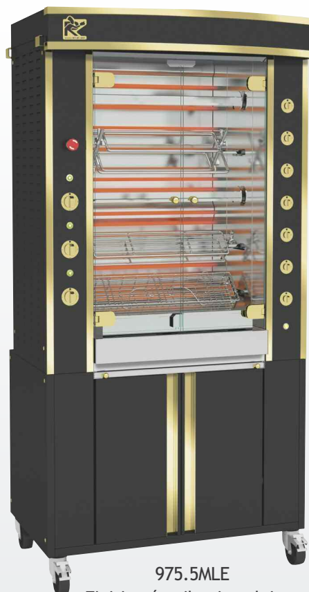
975.5MLE Finition émail noir et laiton