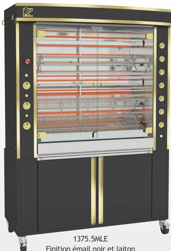
1375.5MLE Finition émail noir et laiton