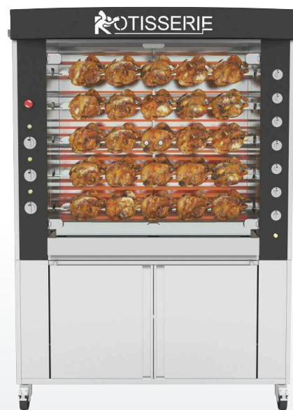
1375.5MSE Finition inox