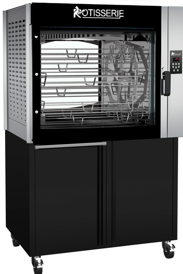
FBPT8.760 + FBP8.760MSTO (armoires de base en option)

Recettes multiples + contrôle manuel (+ possibilité d'ajouter jusqu'à 99 programmes)