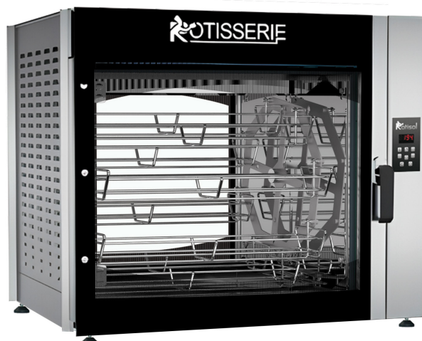
FBPT8.760 + FBP.PIED