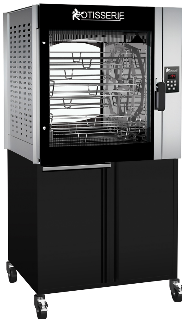
FBPT8.560 + FBP8.560MSTO (armoires de base en option)