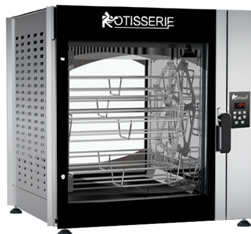
FBPT8.560 + FBP.PIED