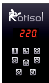
Standard (par défaut)

Avec 6 programmes préréglés+commande manuelle