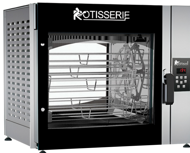
FBPT5.560 + FBP.PIED