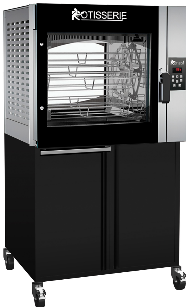
FBPT5.560 + FBP5.560MSTO (armoires de base en option)

Recettes multiples + contrôle manuel (+ possibilité d'ajouter jusqu'à 99 programmes)