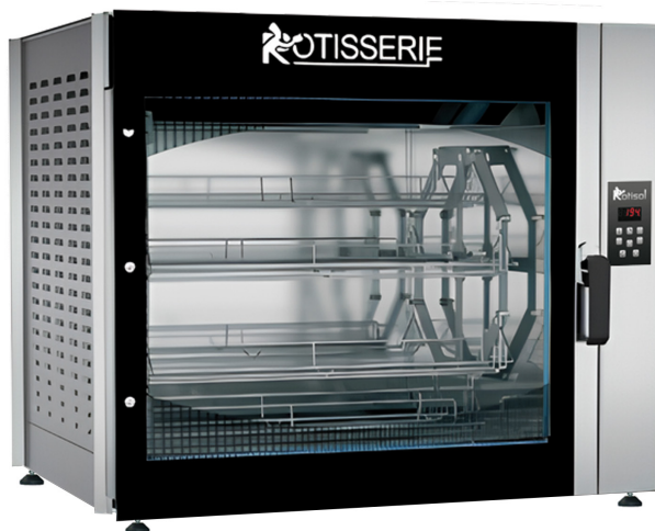
FBP8.760 + FBP.PIED