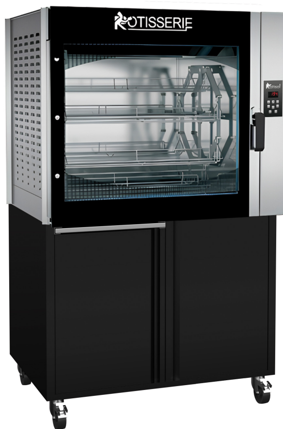
FBP8.760 + FBP8.760MSTO (armoires de base en option)

En outre, K-GLASS minimise l'émission de chaleur dans la cuisine, créant ainsi un espace de travail plus frais et plus confortable pour votre équipe. L'isolation renforcée améliore également la sécurité en évitant les brûlures au contact des surfaces de la porte, garantissant ainsi un environnement de cuisson sûr.