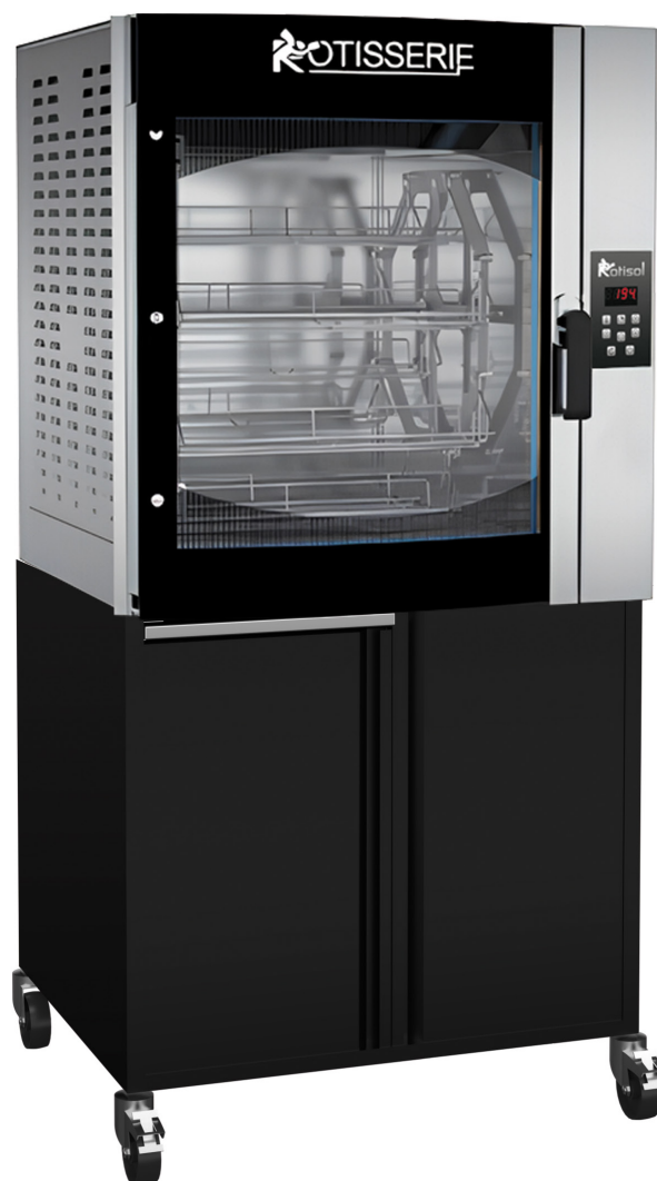
FBP8.560 + FBP8.560MSTO (armoires de base en option)