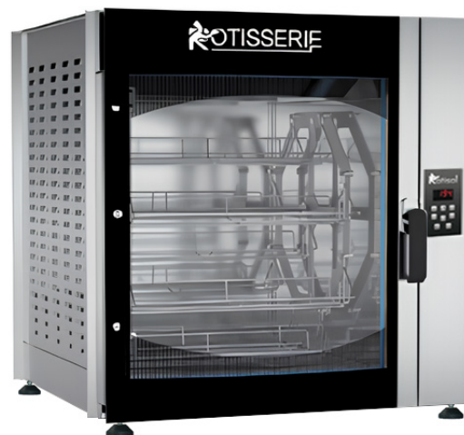
FBP8.560 + FBP.PIED