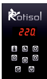
Standard (par défaut)

Avec 6 programmes préréglés+commande manuelle