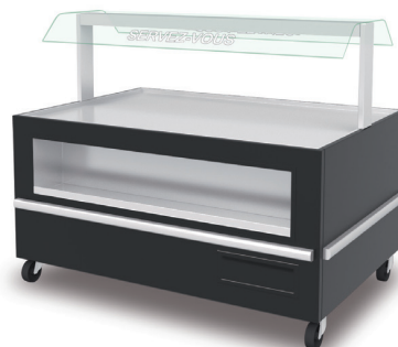
5 15IC + C3 + C5