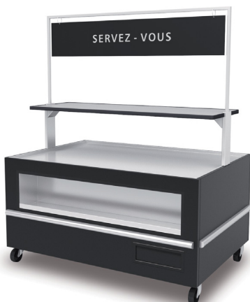
2 15IC + C0 + C2