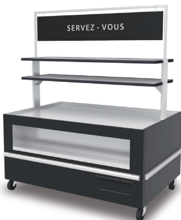
3 15IC + C0 + 2 x C2 + C3