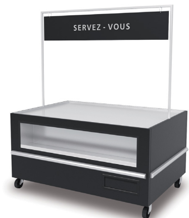
0 15IC + C0