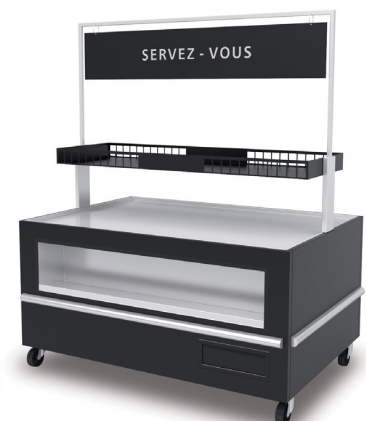
1 15IC + C0 + C1